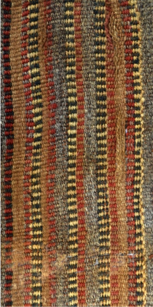
Detalle: Tejido Inka Horizonte tardío