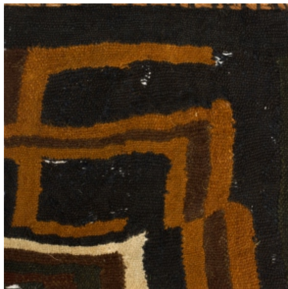
Detalle: Tejido Siwas Intermedio tardío