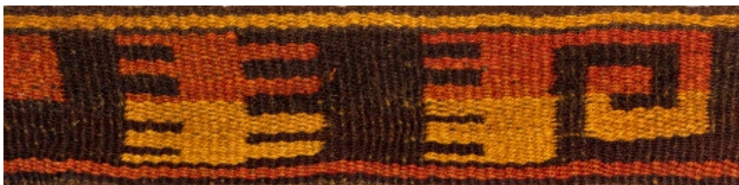
Detalle: Tejido Inka Horizonte tardío