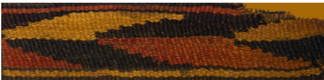
Detalle: Tejido Nazca Intermedio tardío