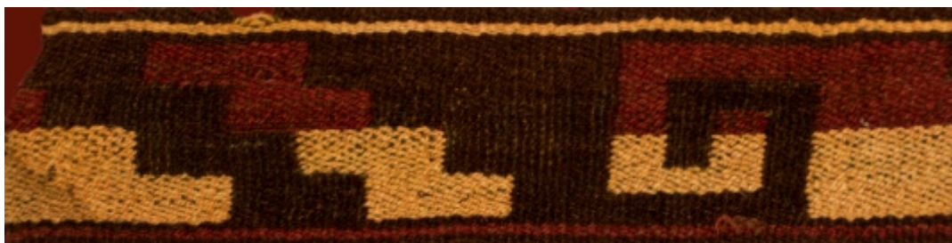
Detalle: Tejido Nazca Intermedio tardío