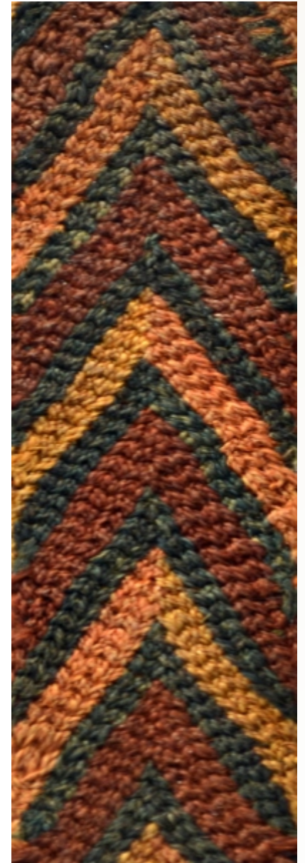
Detalle: Tejido Siwas Intermedio tardío