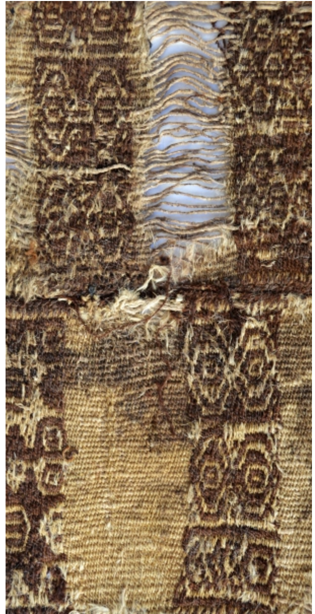
Detalle: Tejido Chiribaya Intermedio tardío