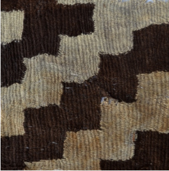
Detalle: Tejido Siwas Intermedio tardío