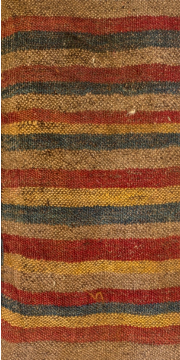
Detalle: Tejido Inka Horizonte tardío