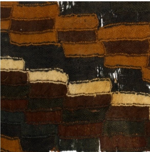
Detalle: Tejido Siwas Horizonte tardío