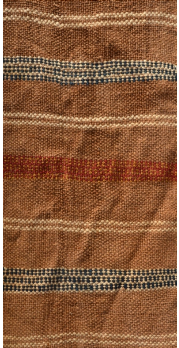
Detalle: Tejido Chiribaya Horizonte tardío