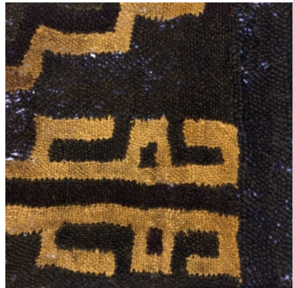
Detalle: Tejido Siwas Intermedio tardío