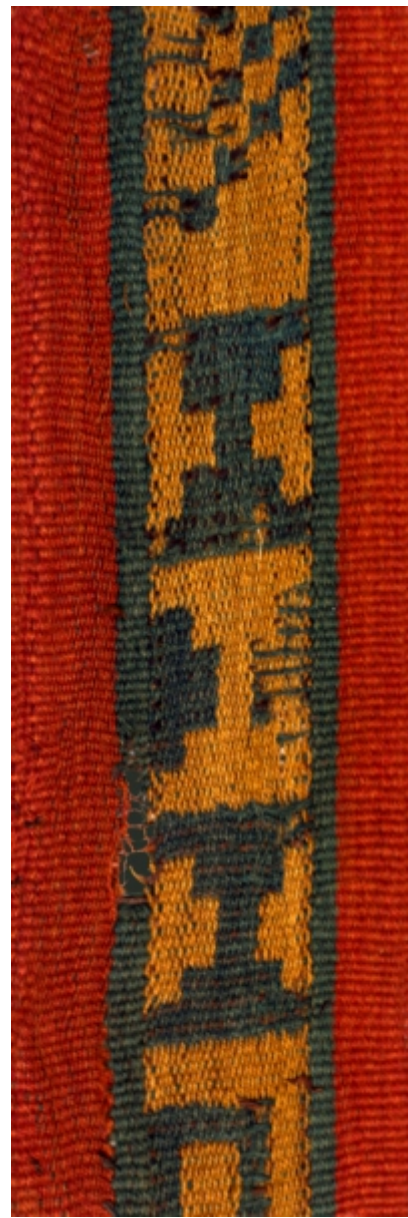
Detalle: Tejido Inka Horizonte tardío