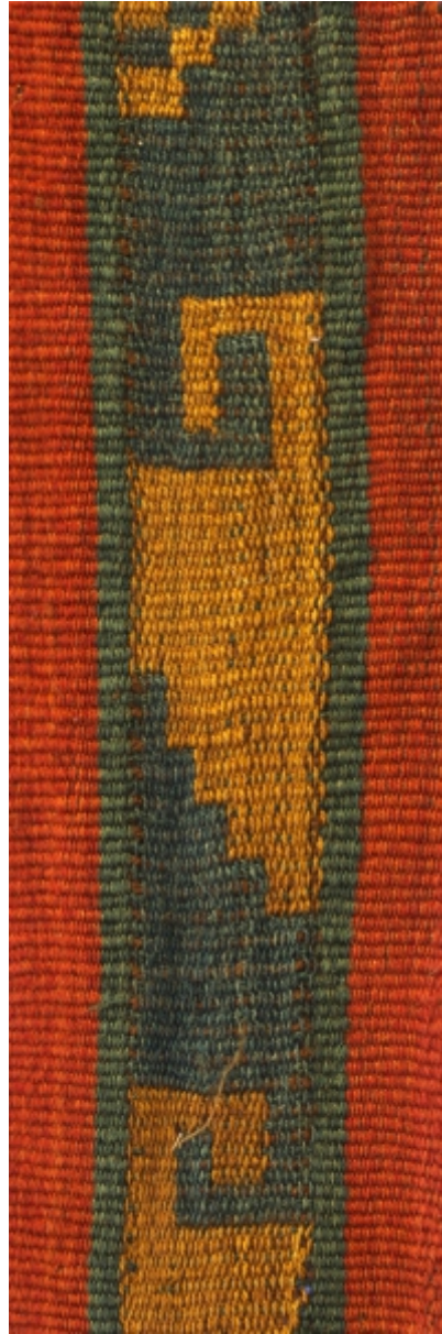
Detalle: Tejido Siwas Intermedio tardío