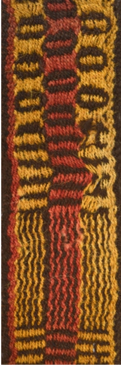
Detalle: Tejido Siwas Intermedio tardío