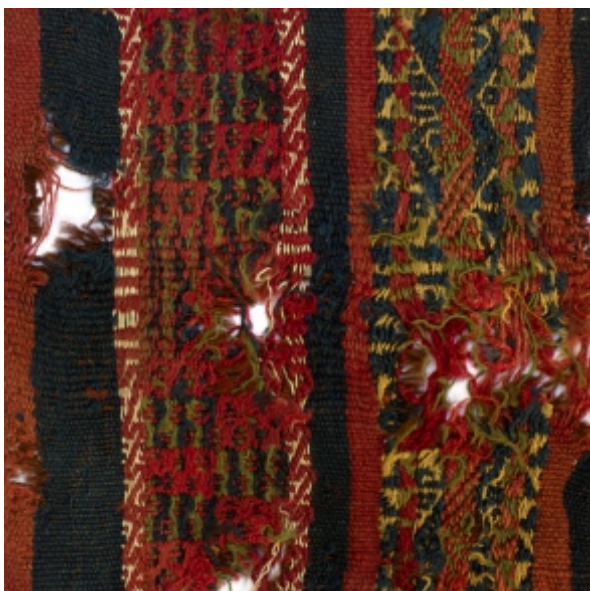
Detalle: Tejido Siwas Horizonte tardío