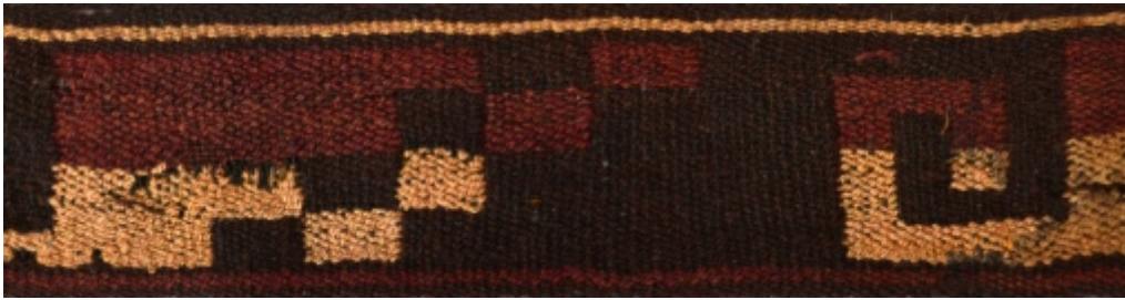
Detalle: Tejido Nazca Intermedio tardío