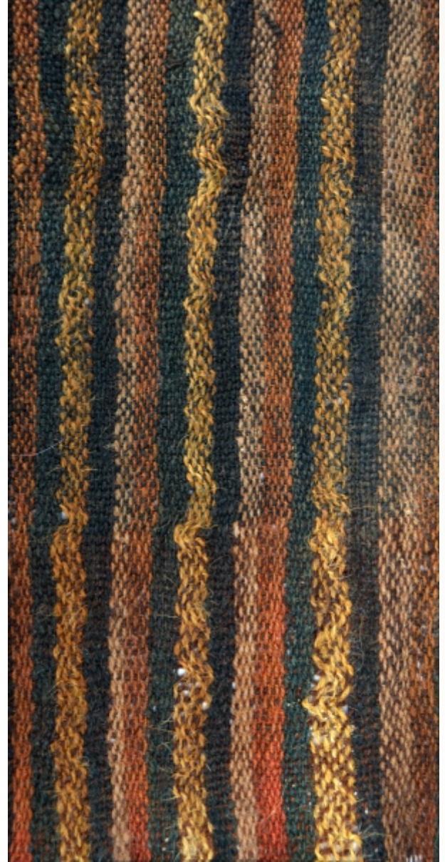
Detalle: Tejido Chiribaya Horizonte tardío