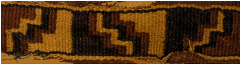
Detalle: Tejido Nazca Intermedio tardío