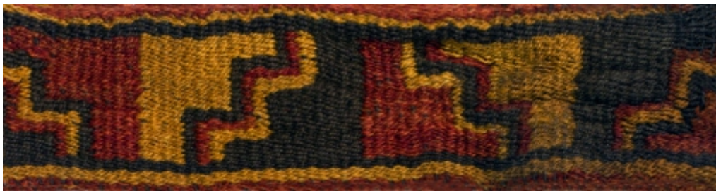
Detalle: Tejido Nazca Intermedio tardío