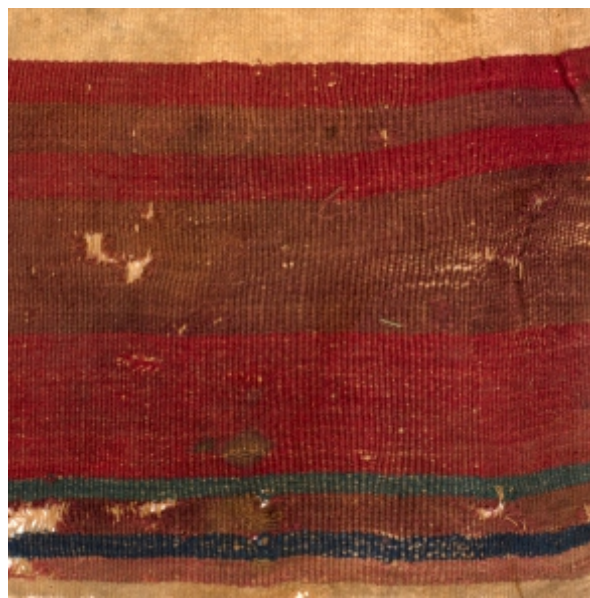
Detalle: Tejido Inka Horizonte tardío