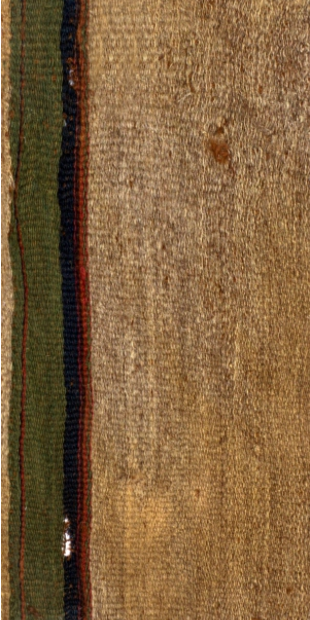
Detalle: Tejido Siwas Intermedio tardío