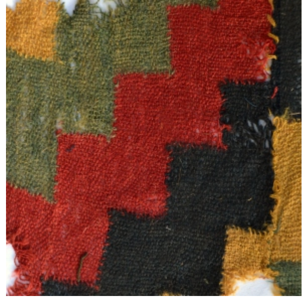
Detalle: Tejido Inka Horizonte tardío