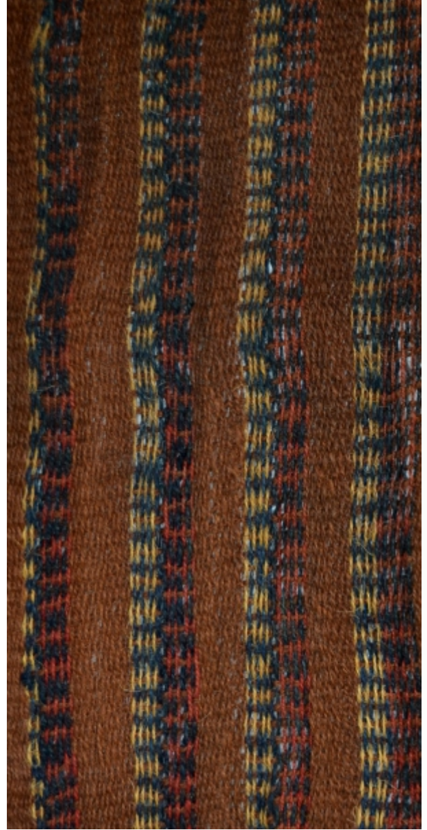
Detalle: Tejido Inka Horizonte tardío