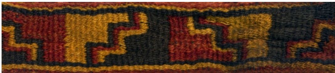
Detalle: Tejido Nazca Intermedio tardío