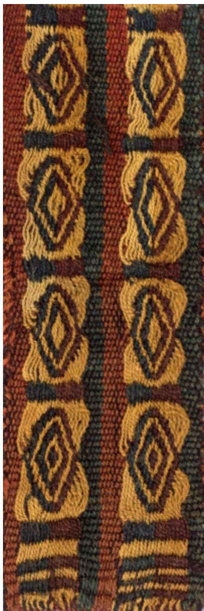
Detalle: Tejido Siwas Intermedio tardío