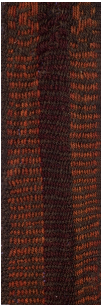
Detalle: Tejido Siwas Intermedio tardío