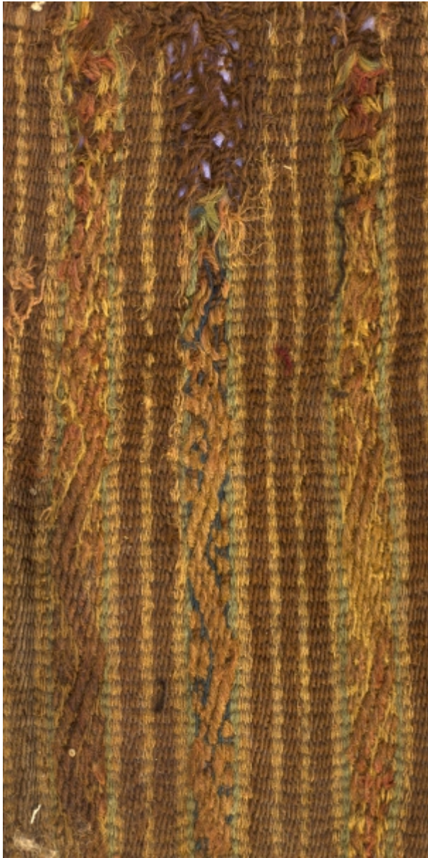
Detalle: Tejido Chiribaya Intermedio tardío