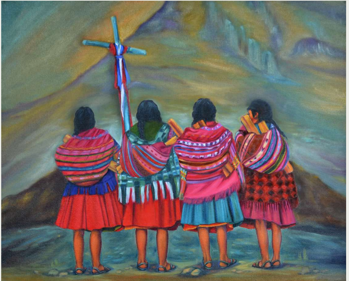
CRUZCHAKUY Óleo sobre lienzo 50 cm x 60 cm