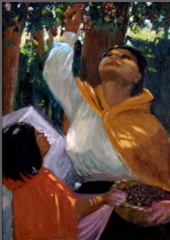
S/T • Óleo/lienzo • 62 x 44 cm.