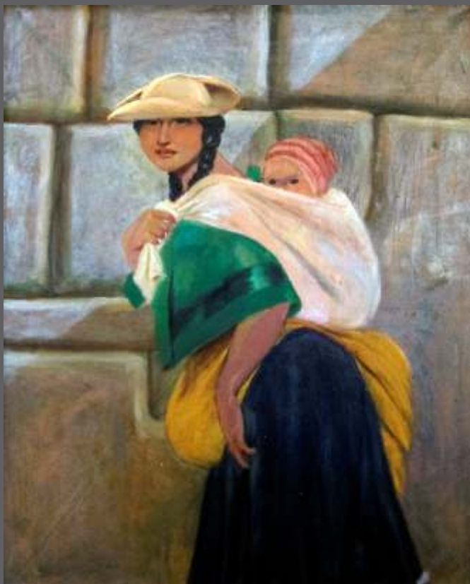
S/T • Óleo/lienzo • 81 x 100 cm.