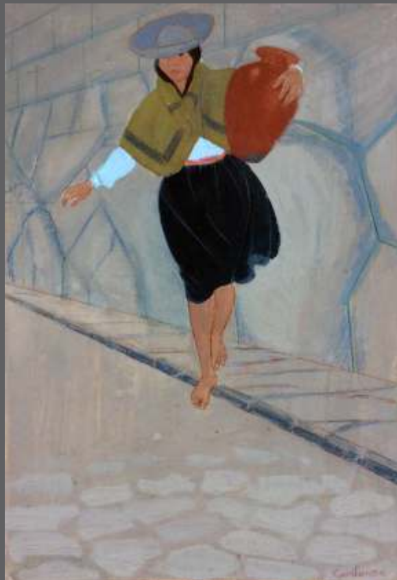
PPASÑA/SERVANTE Gouache/papel • 46.5 x 31 cm.