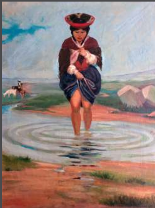
S/T • Óleo/lienzo • 81 x 65cm.