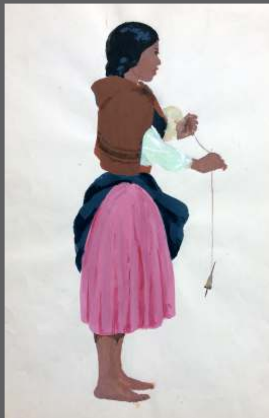
S/T • Gouache/papel • 54 x 37.5 cm.