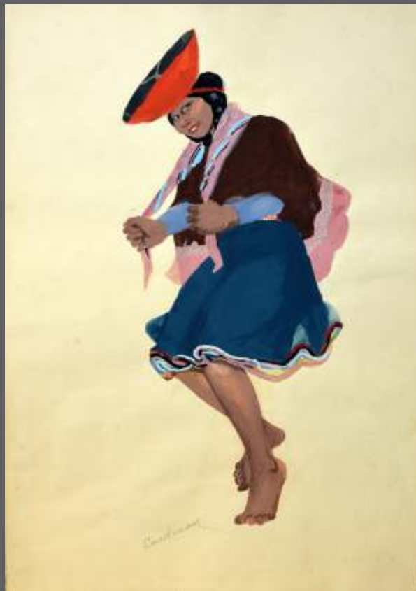
S/T • Gouache/papel • 39 x 27.5 cm.