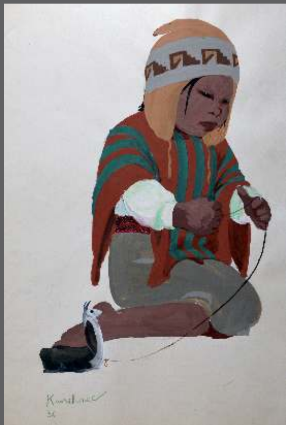
S/T • Gouache/papel • 52.5 x 37.5 cm.