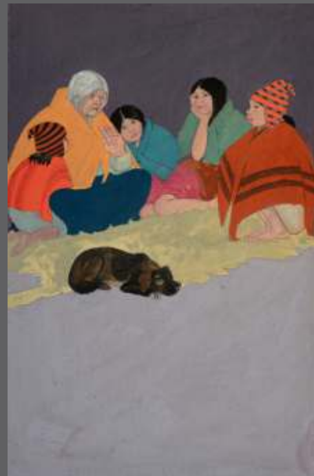
INASPARU IL ÉTAIT UNE FOIS Gouache/papier • 46.5 x 32 cm.