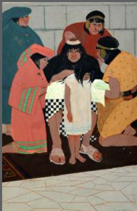
CHUCCHA RUTUCUY PREMIÈRE COUPE DE CHEVEUX Gouache/papier • 46 x 32 cm.