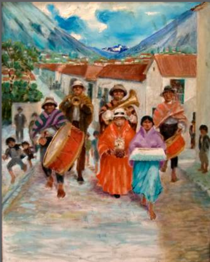
S/T • Óleo/lienzo • 80 x 64.5 cm.