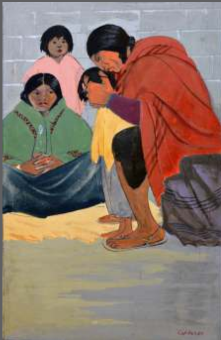
AMPICUC/GUÉRISSEUR Gouache/papier • 46.5 x 32.5 cm.