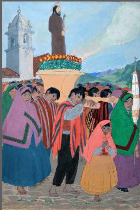
S/T • Gouache/papel • 36 x 24.5 cm.