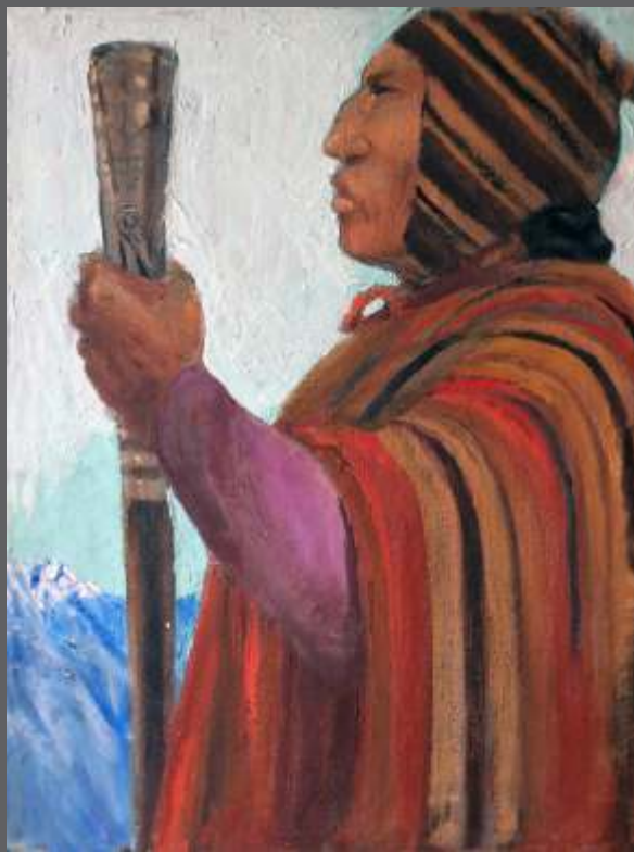
S/T • Óleo/lienzo • 55 x 40 cm.