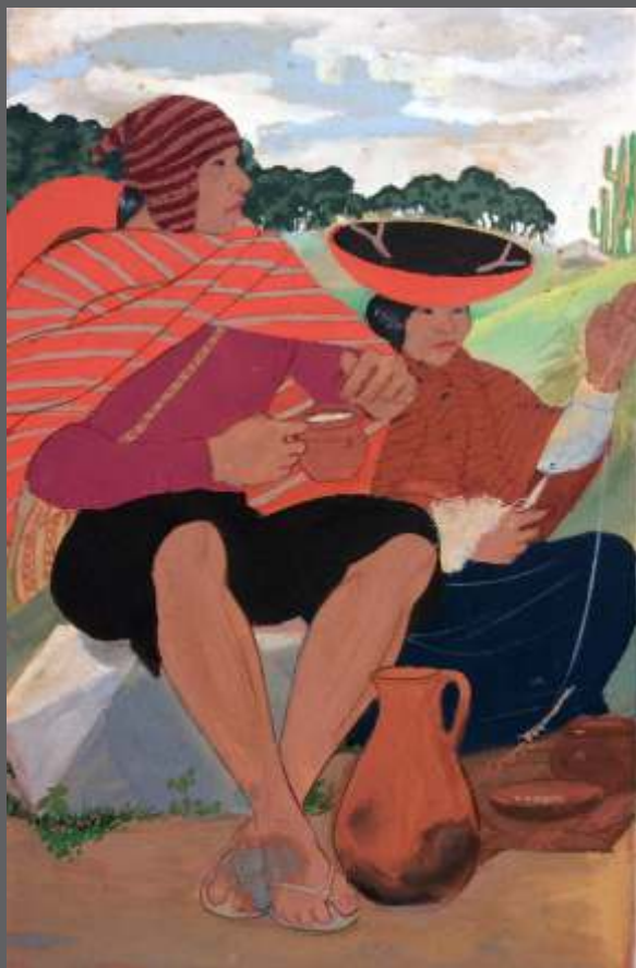
S/T • Gouache/papel • 46 x 32 cm.