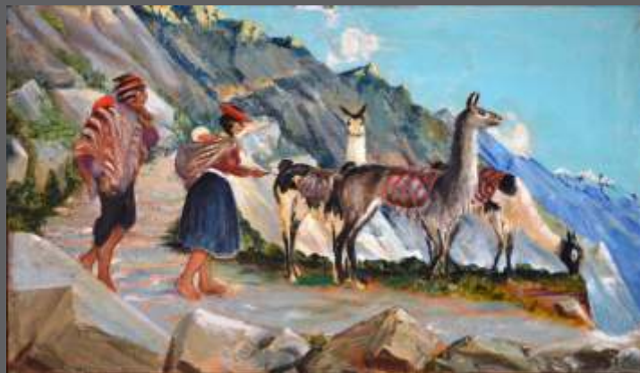
S/T • Óleo/lienzo • 60 x 100 cm.